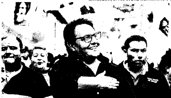
O presidente-eleito foi morto a tiros em Quito enquanto deixava um encontro político

De acordo com as investigações, o suspeito em questão foi visto nas imagens fugindo do local do crime e estaria acompanhado do homem que morreu em uma troca de tiros com a polícia minutos após atirar contra o presidente-eleito e matá-lo. Entre as armas encontradas no local, havia um fuzil, uma metralhadora, quatro