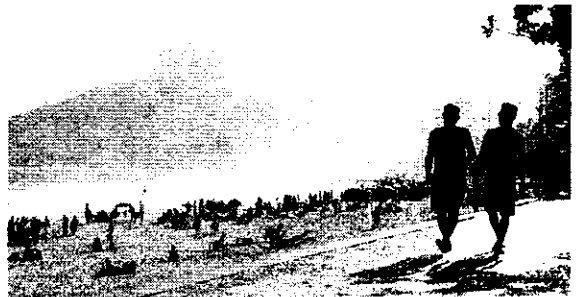
O Brasil detém o segundo lugar em recuperação no pós-pandemia

Os recursos injetados no ano passado na economia brasileira por visitantes vindos do exterior superam em 1,5% a maior arrecadação obtida com o turismo internacional, registrada em 2014, por exemplo. Naquele ano, o país foi sede da Copa do Mundo de futebol e recebeu muitos turistas estrangeiros de todo o mundo. A meta estabelecida no Plano Nacional de Turismo era de crescimento de 8,5% na receita gerada pelo turismo internacional em 2023. O resultado, no entanto, mostrou crescimento anual de 41%. Já em 2022, os turistas interna-